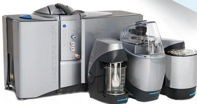
Granulômetros a Laser